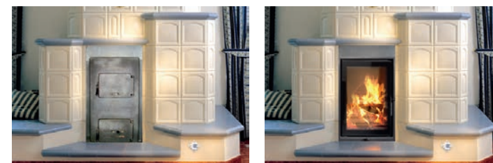
vorher – mit altem Heizeinsatz

Je nach Maß Ihres alten Einsatzes können Sie sich zwischen vielen Modellen aus dem Schmid und Olsberg Sortiment entscheiden. Die Schmid Feuerungstechnik hebt sich durch eine enorme Vielfalt von anderen Herstellern ab – sowohl in Sachen Aussehen und Leistung, als auch das optionale Zubehör betreffend: Für eine noch bessere Nutzung der Heizleistung kann bei vielen Geräten z. B. die neue Schmid Multi-Regelung, wahlweise kombiniert mit Wassertechnik, angeschlossen werden.